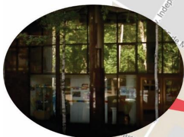
Instituto Movilizador de Fondos Cooperativos