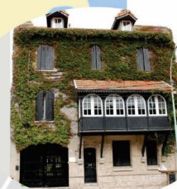
La Casa del Balcón