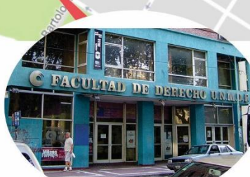
Facultad de Derecho