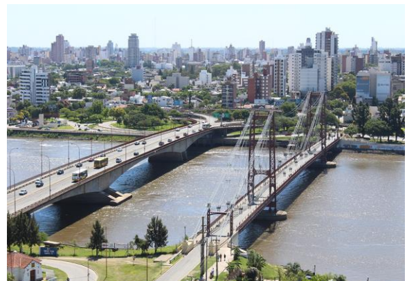
Vista panorámica del centro urbano