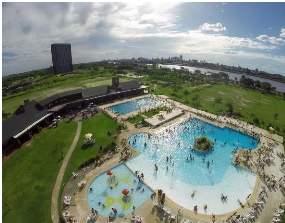
Predio UNL-ATE y Ciudad Universitaria