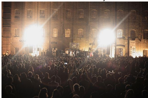
Centro Cultural "Molino Marconetti"