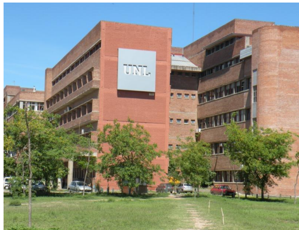
Ciudad Universitaria. Facultad de Humanidades y Ciencias