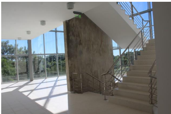
Aulario común en la Ciudad Universitaria. FHUC-FADU