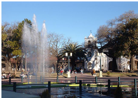
Parque Sur. Plaza de las dos culturas