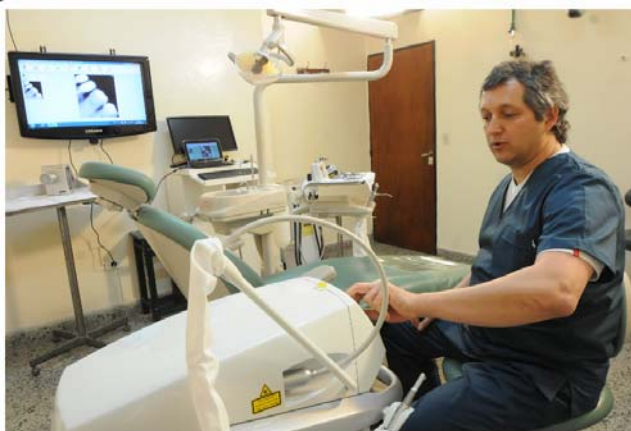
El Hospital Odontológico cuenta con nuevo equipamiento